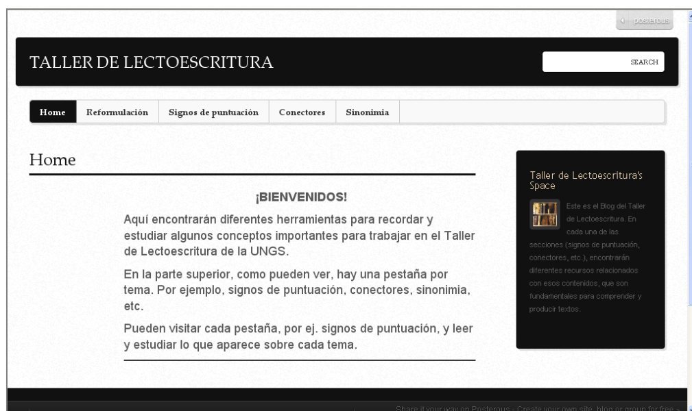
Figura 1. Blog del Taller de Lectoescritura.

En cuanto a la propuesta didáctica, se determinó, en primer lugar, que el FB se iba a combinar con un blog que funcionaría a modo de reservorio de los materiales teóricos, en formato pdf., sobre los contenidos involucrados en las actividades de reformulación. Así, el Blog fue diseñado con un encabezamiento en el que se indicaba el título “Taller de Lectoescritura” y una serie de pestañas con los siguientes títulos: Home , Signos de puntuación , Conectores , Sinonimia y Reformulación .