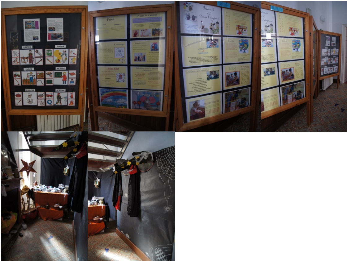
Tots els racons estaven aprofitats; els passadissos d'accés a cada ambient amb plafons i mostradors i, fins i tot, un racó sota una de les escales d'accés a la segona planta