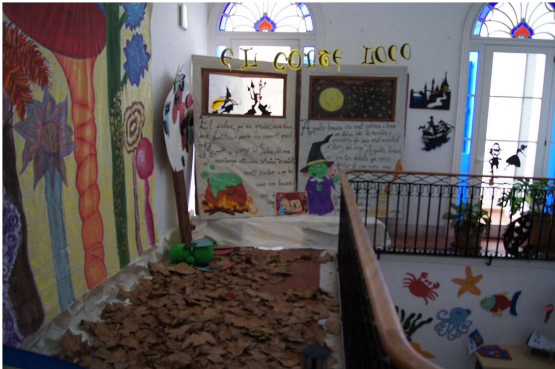
A la primera planta, els estudiants aprofitaren el lloc per muntar-hi tot l'escenari d'una petita obra de teatre que van representar diferents vegades en el marc de l'assignatura Teatre a l'Escola Infantil.