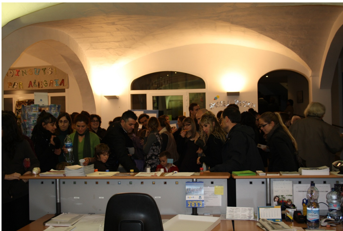
Inauguració de l'exposició i convidada a tots els participants.