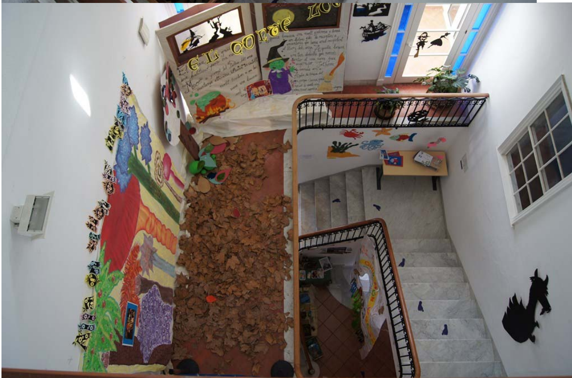
En aquestes dues darreres fotografies podem veure una perspectiva global de l'exposició des de la segona planta de l'edifici