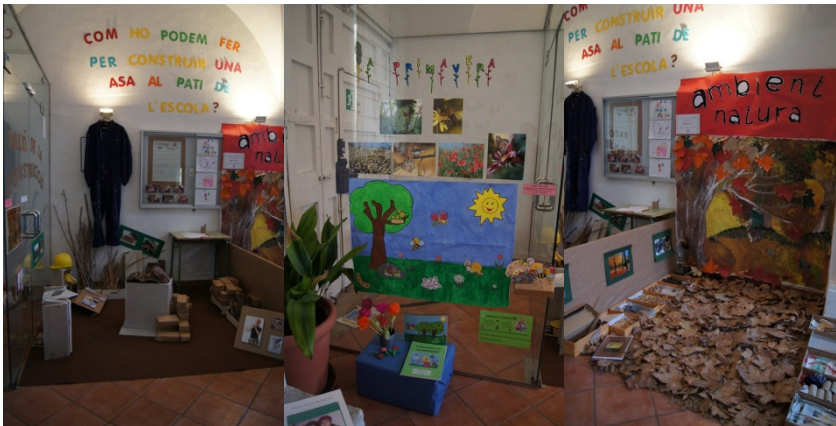
A continuació s'anaven obrint els diferents espais i racons dissenyats, com podem veure en aquestes fotografies.