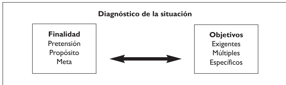
GRÁFICO II. Fases de la planificación de la actividad preventiva

Se podría definir esta fase de planificación como el «diagnóstico de las condiciones previas individuales y sociales –tanto de profesores como de alumnos–, al objeto de determinar, fundamentalmente, sus experiencias, su instrucción, sus necesidades, sus intereses y su situación socioambiental y laboral» (Ferrández y González Soto, 1992, p. 270). A partir del diagnóstico realizado por el equipo directivo del centro escolar, cabría destacar la definición de objetivos en función de la realidad del centro o aula y la finalidad perseguida. Estos objetivos deben ser: