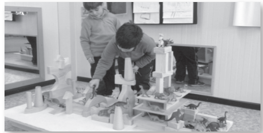
TALLER DE LES CONSTRUCCIONS