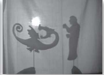
TALLER DE CONTES