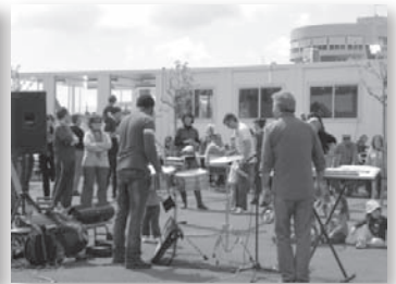
Col·laboració musical d'un pare en la Festa de la Primavera 2009