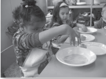
TALLER DE CUINA

matemàtic, musical..., i puguin desenvolupar la creativitat.