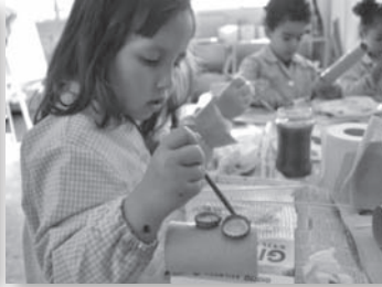
TALLER DE L'ART