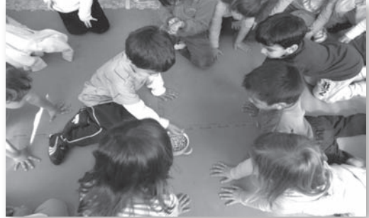
Un infant que és l'eix de tot el procés d'aprenentatge