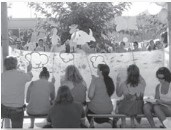
Pares fent una representació teatral en la festa de l'estiu 2010