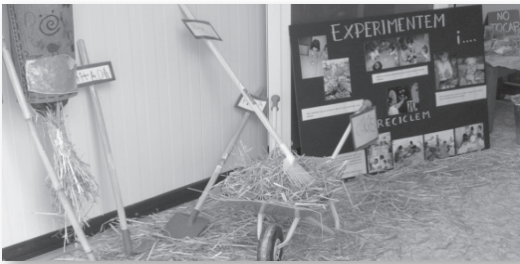
TALLER DE L'HORT