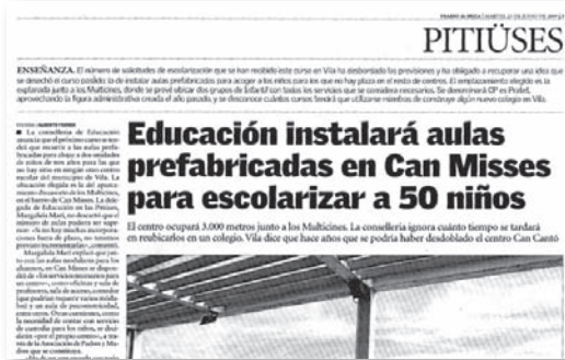
23 de juny de 2009

La feina que va fer l'equip de mestres amb professionalitat i il·lusió féu possible engegar un projecte educatiu de qualitat, encara que periòdicament fos notícia a la premsa.