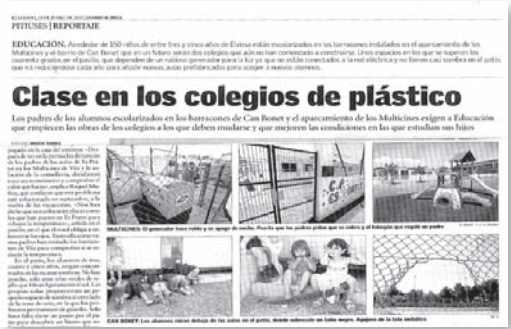
19 de juny de 2010

Posar en marxa un centre de nova construcció en les condicions de l'estructura prefabricada ha estat un repte que hem anat desenvolupant paral·lelament al nostre projecte pedagògic.