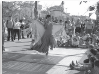
Actuació de ball espanyol d'una mare en la festa de l'estiu 2011