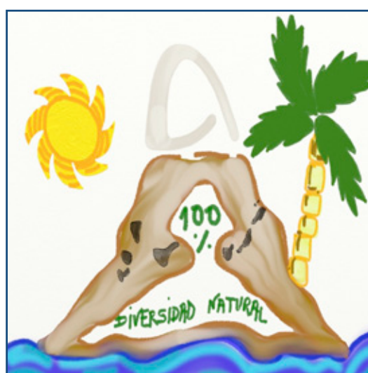
Finalista IES Doctoral (Las Palmas_ Canarias)