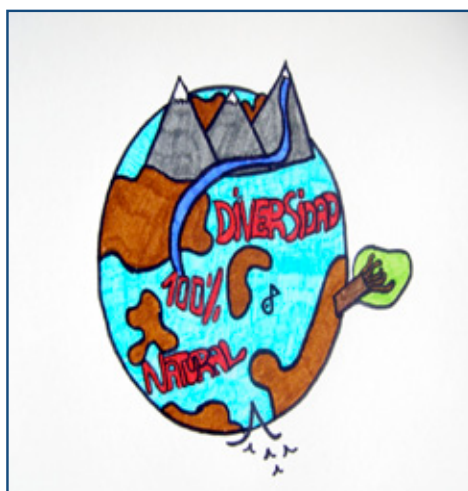
Finalista IESO Gabriel García Marquéz (Tiétar-Cáceres-Extremadura)