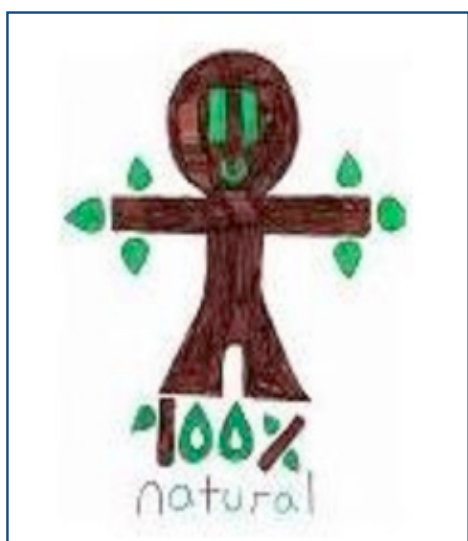
1er PREMIO IES Pompeu Fabra (Martorell-Barcelona)