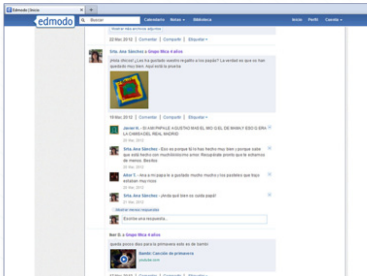
Muro grupo neolectores

CEIP Gonzalo Encabo de Talayuela, Cáceres.