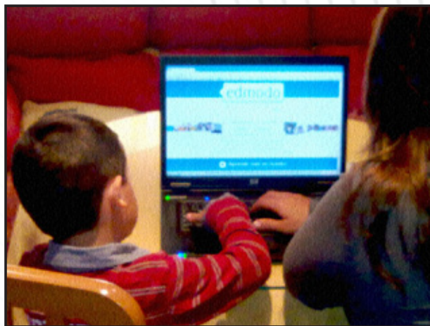
EDMODO en casa.