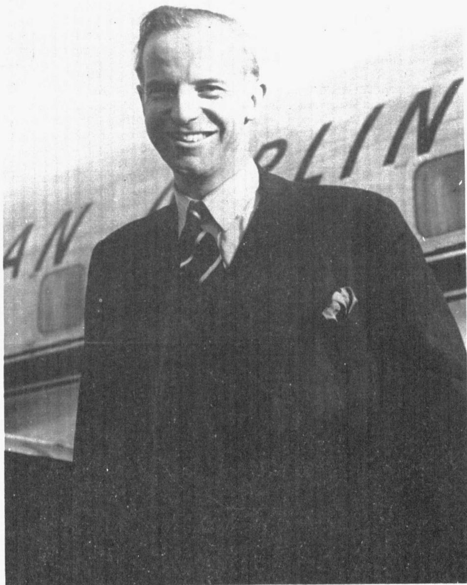
Sir John MAUD

de 1947, se aplicó a la UNESCO el 7 de febrero de 1949 y, en espera de que la Convención fuera ratificada por los Estados Miembros, se concluyó un acuerdo con la ONU para permitir a los funcionarios de la UNESCO el uso del "laissez-passer" de las Naciones Unidas.