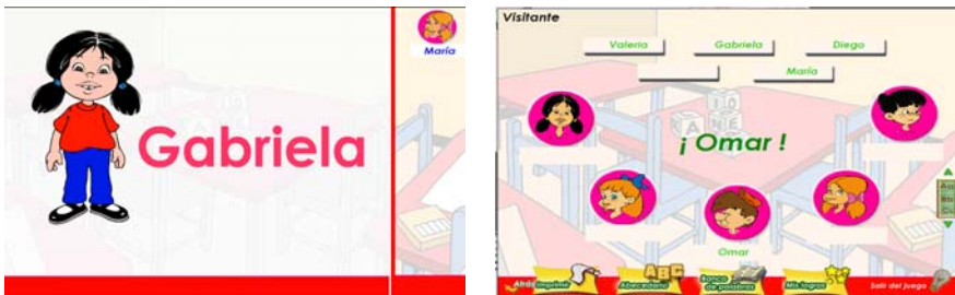
Figura 1. Pantalla presentación de “Reconozco mi nombre” y “área de trabajo”.

Por esta razón realizamos una selección de temáticas que serían la base para desarrollar las diferentes actividades que tuviese un alto nivel de significación y familiaridad para los niños dentro de su entorno personal, familiar, escolar y comunitarios: sus nombres propios, los animales o mascotas familiares, la comunidad donde se desenvuelve (servicios y servi-