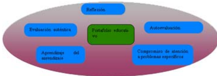
Ilustración 1: Acciones que implica el portafolio electrónico. A partir de García (2000)

h) Portafolios para el empleo: documentan la preparación que convencerá al futuro empleador de su competencia en áreas como capacidades básicas, solución de problemas, adaptabilidad y habilidades de