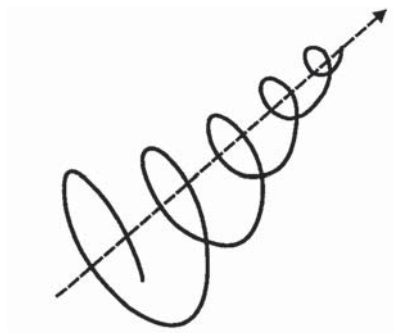
Figura 1. Espiras de la creatividad

Puede hacer referencia al fenómeno global o en su defecto a fases o momentos que invariablemente tienen lugar en cualquier proceso creativo. Equivaldría a la espiral o partes de la trayectoria espiral en su proceso evolutivo, enrollada sobre su eje plectonícamente. Por su carácter de totalidad, concomitarían con el centro de la circunferencia o el eje de la espiral.