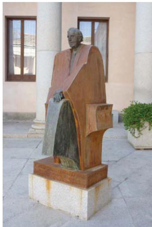
Foto 3. Estatua conmemorativa de D. Julián Besteiro en el patio del Palacio Lorenzana inaugurada en 1990 con motivo del cincuentenario de su muerte.

Tomó partido, lógicamente, en las polémicas que se desataron en el Claustro, esencialmente debidas a las iniciativas de Teodoro San Román y de Gregorio Álvarez Palacios. Pero al no desempeñar ningún cargo directivo, sus intervenciones respecto a la política educativa del centro no fueron especialmente relevantes. En general, muestran a nuestro personaje con unos criterios docentes abiertos y progresistas. Tenemos la impresión de que Besteiro encontró en su cátedra un refugio frente a las más agitadas experiencias políticas y periodísticas de la vida toledana. Los relativos enfrentamientos en su labor académica con Teodoro San Román, o con Gregorio Álvarez Palacios, son civilizados y corteses, manteniendo este respeto mutuo en los debates que como adversarios políticos tenían su continuidad en el Ayuntamiento. Porque, aún primando las diferencias, éstas se atenuaban dentro del despacho del palacio Lorenzana: la adscripción a la misma élite profesional (aunque en una ocasión critique a su propio colectivo 11 ), una labor docente seria y responsable con el alumnado, la confluencia en la defensa de la enseñanza pública ("oficial" se denominaba entonces) y la común idea de regenerar España mediante la educación y la instrucción, pueden ayudar a explicarlo.