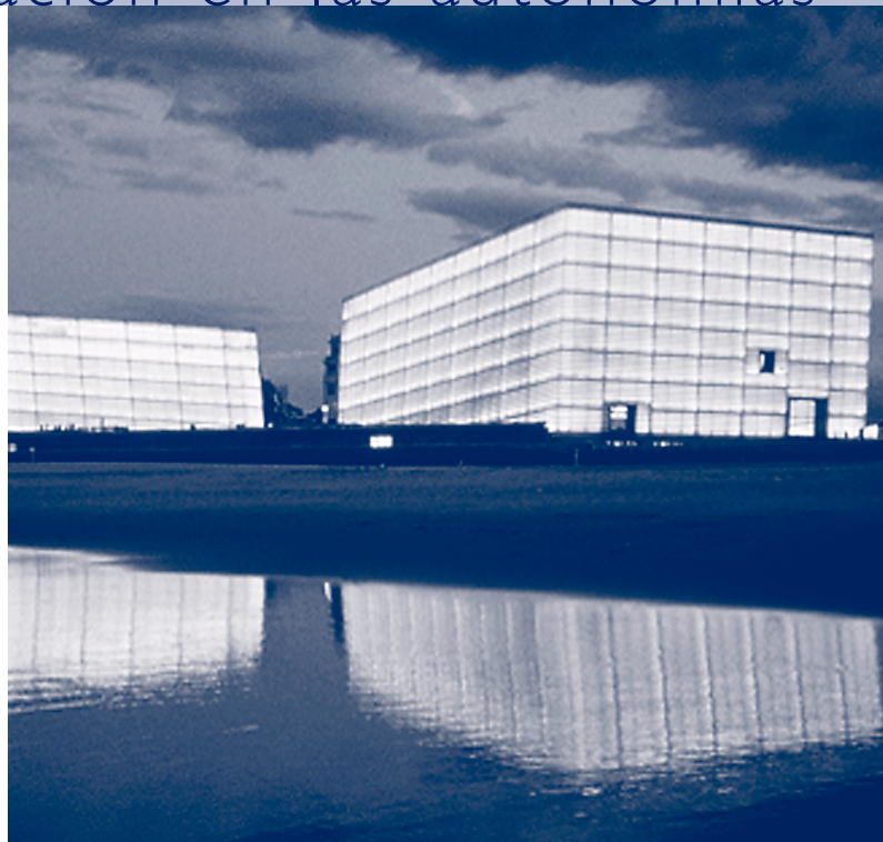
Auditorio y Palacio de Congresos Kursaal (San Sebastián)

vida es el de establecer una relación positiva con uno mismo y con los demás, y es el eje fundamental de la educación en valores que incluye los objetivos de todas las líneas transversales.