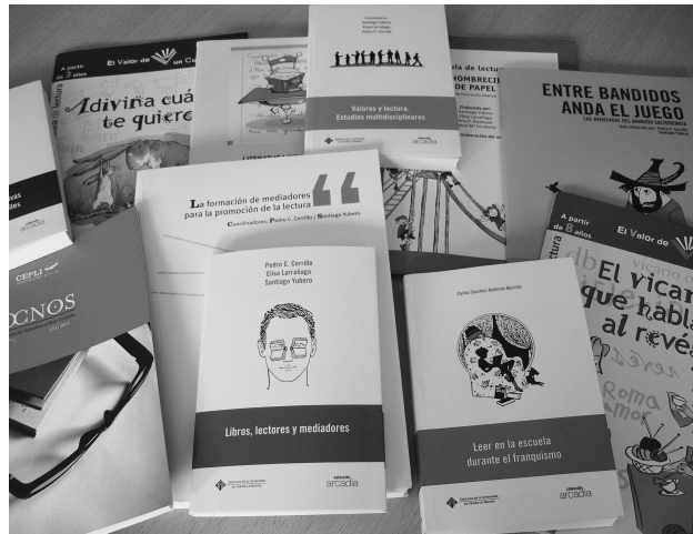
Algunas de las publicaciones del Centro.

Dentro de las distintas publicaciones, el CEPLI acaba de editar el primer número de la Revista de Estudios sobre Lectura , OCNOS, que nace con el objetivo básico