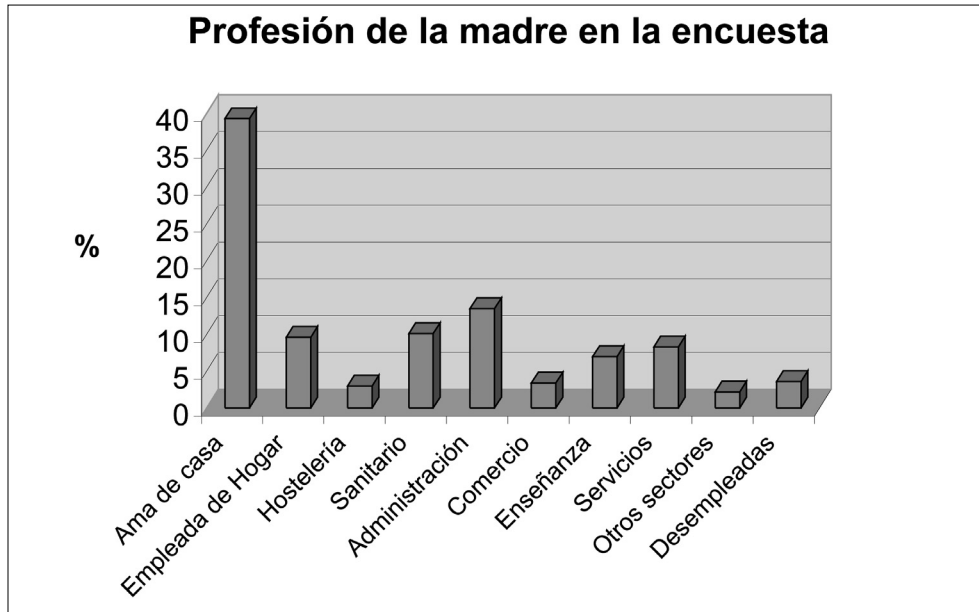
Destaca que casi el 40% se califica como ama de casa.

La respuesta a estos retos se materializó en un primer proyecto realizado conjuntamente con el AMPA. Le dimos el nombre de “Abierto por las tardes” y se concretó en: