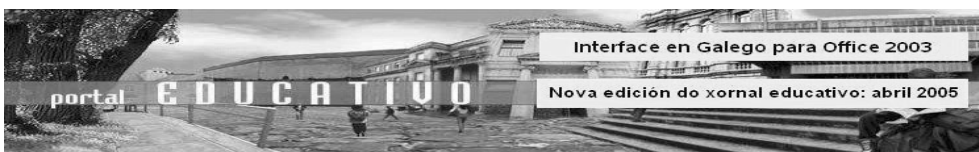
Portal educativo de Galicia.