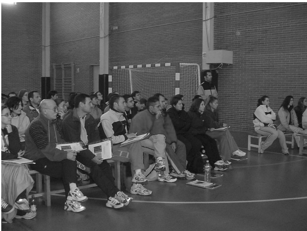
El programa cumple su novena edición.

Además, en cuanto a su localización, los cursos se distribuyen por todas las provincias de la región, facilitando el acceso a dichos cursos a los profesionales del mundo deportivo de las cinco provincias castellano-manchegas, e igualmente el acceso de profesionales de otras regiones que acuden a los cursos organizados en Castilla-La Mancha.