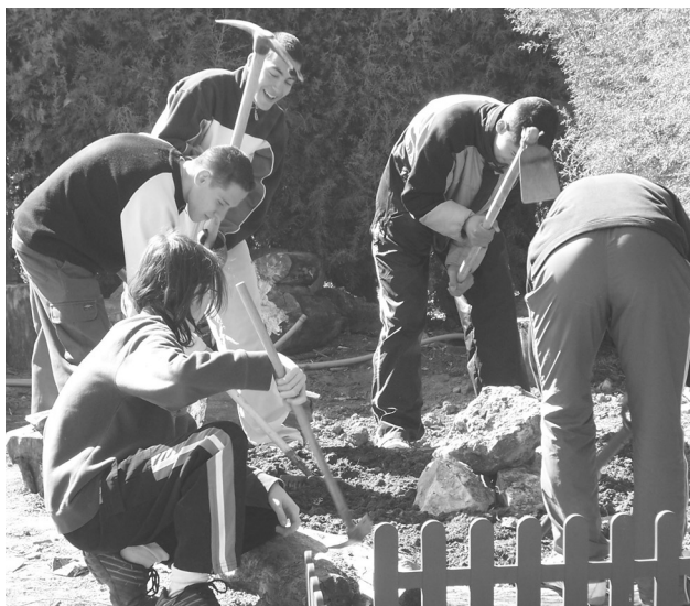
Se fomentan la colaboración y la convivencia.

Durante el curso pasado experimentamos la figura de alumno-monitor en Taller de Teatro, dirigido exclusivamente a los alumnos más desenganchados del sistema. El resultado fue lo suficientemente satisfactorio como para continuar con la experiencia en el curso 2004/05. En este curso estamos tratando de institucionalizar esta figura, y así, los alumnos del Ciclo Superior de Integración Social que se imparte en el centro, asesorados por una profesora, han puesto en marcha un taller