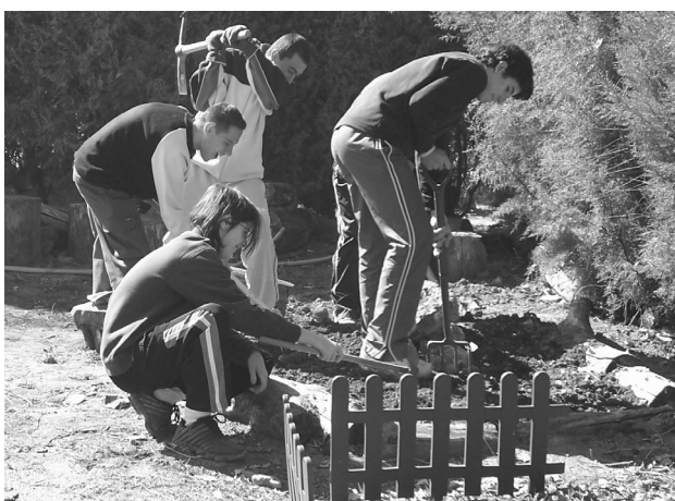
Grupo de alumnos de integración.

Las alternativas regladas presentan límites de edad y obligan a buscar nuevas fórmulas para alumnos más jóvenes, siempre teniendo en cuenta sus características individuales. Los alumnos que se incorporan a los programas de diversificación curricular presentan, a veces, desde tiempo atrás, deficiencias instrumentales y de base que deben subsanarse cuanto antes para aumentar sus posibilidades de conseguir el graduado en