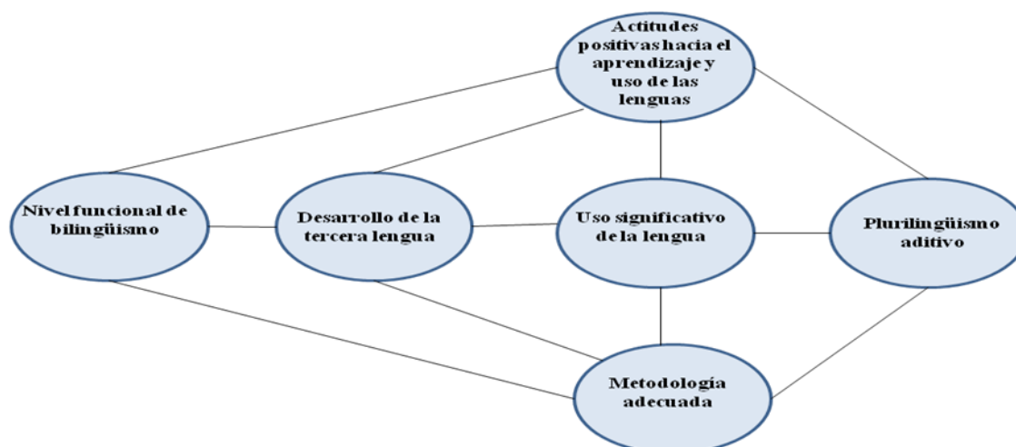
Figura 1. Bases que sustentan el plan de educación lingüística de los futuros docentes

(1995) defiende una postura similar y habla de pluricompetencia y Jessner (1997) destaca el carácter dinámico de la competencia plurilingüe. A lo largo de la vida, una persona puede ir pasando del monolingüismo al bilingüismo o al plurilingüismo en función de sus necesidades de comunicación. Por lo tanto, la competencia lingüística de un plurilingüe está conformada por una serie de subsistemas lingüísticos que interactúan de modo dinámico y están sometidos a constante variación. La figura que presentamos a continuación ilustra las bases que sustentan el plan de educación lingüística que hemos diseñado: