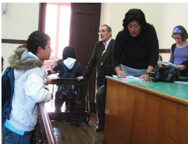
Foto 6. Almudena Grandes con alumnos.

Con anterioridad a estos encuentros, los alumnos han de preparar estas entrevistas. Y se concluirá con un debate en el que se defenderán posturas y argumentarios enfrentados para llegar a establecer una opinión personalizada.