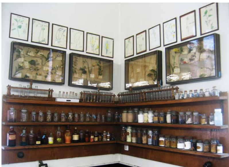
Foto 3. Trabajos de alumnos y semillas.