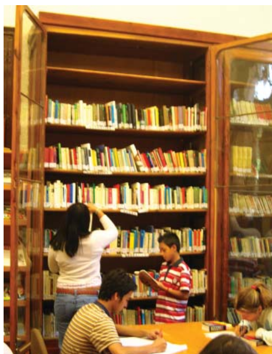
Foto 5. Alumnos consultando libros de los armarios de la biblioteca.

- Comparar, resumir, extractar artículos periodísticos de la prensa de hace más de un siglo y la actual. Los alumnos han de organizar toda la información, seleccionar aquella que les interesa para sus actividades y presentarla de acuerdo a las normas prefijadas.