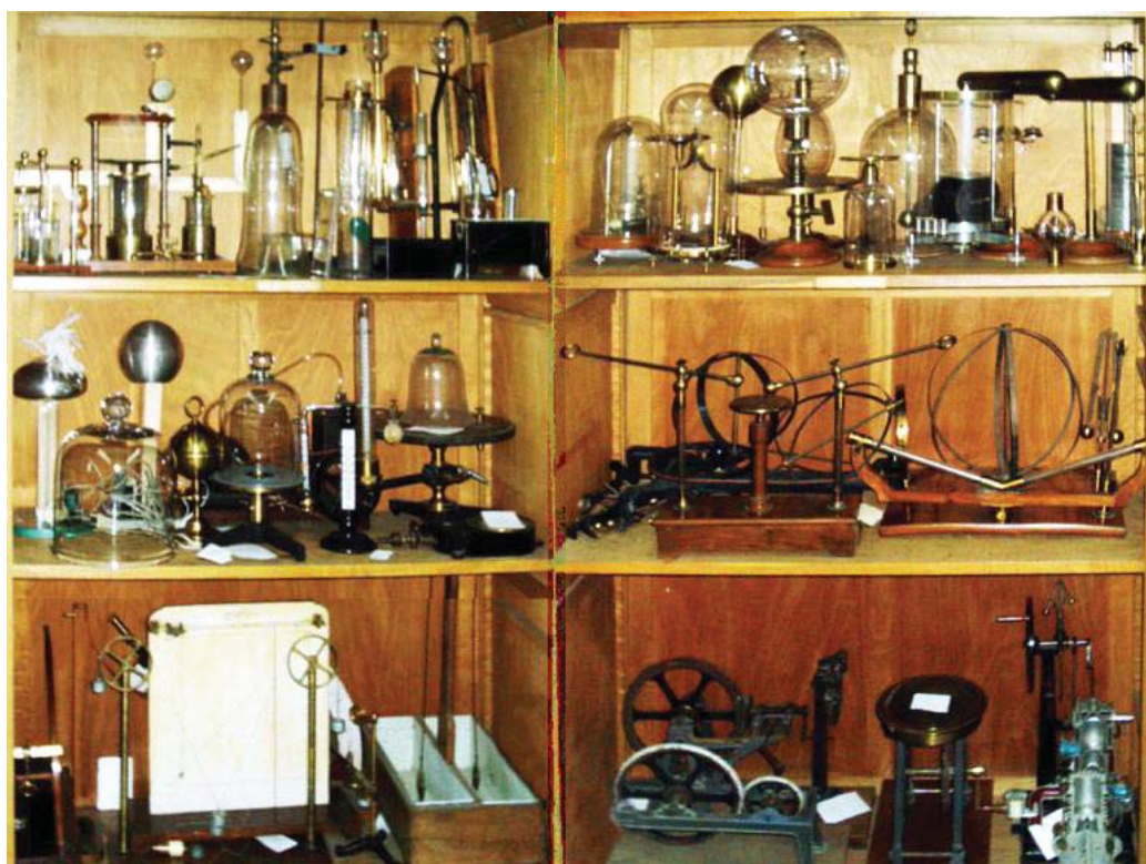
Foto 4. Aparatos de Física.

En el laboratorio de Física pueden conocer el fenómeno de la dilatación cúbica al observarlo mediante el llamado piroscopio o anillo de S`Gravesande . Para la demostración de las leyes de la reflexión y refracción se utiliza el aparato de Silbermann . La síntesis de la luz consiste en el fenómeno contrario al de la dispersión y puede lograrse juntando distintos colores del espectro, consiguiendo por ello luz blanca. Se experimenta con el disco de Newton . La fuente intermitente es un aparato ideado por Sturm , que sirve para ver los efectos de la presión ejercida por el aire en la salida intermitente de un líquido, estos aparatos y otros 300 como el tribómetro de Coulomb o los tubos de Mariotte son adquiridos a partir del año 1874 en París y Alemania y siguen despertando el interés de los alumnos de bachillerato, además de facilitar la comprensión de los conceptos de Física.