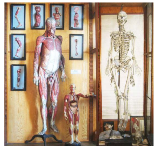
Foto 2. Hombre clásico. Esqueleto.