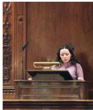
Foto 7. Alumna leyendo en el Paraninfo de la Universidad de Madrid.

En el púlpito del Paraninfo de la Universidad de Madrid los alumnos leen textos de los catedráticos del Instituto del Cardenal Cisneros que colaboraron con Fernando de Castro y de Clara Campoamor y, finalmente, en el Consejo Escolar del Estado intervienen con preguntas sobre la realidad más cercana y harán oficial el nombramiento de la Presidenta del Consejo como Madrina de Honor del Gabinete de Historia Natural, a propuesta de los alumnos de 4 º .