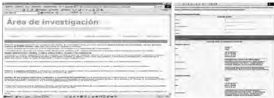
Figura 4. Página de entrada al área de investigación.

Para dejar más claramente definido el espacio de trabajo, se le habilitó otra entrada alternativa (figuras 4 y 5). A través de ella, hicimos pública la invitación de participación y del proyecto. El formulario a través del cual los alumnos solicitaban su inclusión en la investigación también estaba situado en esta entrada. Esta página, «investiga con nosotros», ocultaba objetivos de seguridad. Con ella, pretendíamos crear un filtro para el foro y dar la seriedad suficiente como para que el formulario de alta no fuese utilizado por personas ajenas a la asignatura. En definitiva, estábamos trabajando en un espacio de acceso público. El marco institucional del site nos proporcionó un contexto lo suficientemente formal como para que el trabajo fuese respetado. Esto, que en principio creó bastantes dudas, ha funcionado bien por el momento.