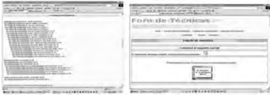
Figura 6. Foro de técnicas.

pas del proceso, la diseñamos accesible desde la páginas inicial del site y la pusimos en todas las barras de navegación.