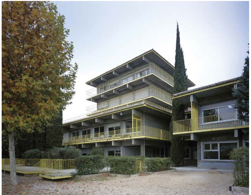
Foto 1. Fachada principal y torre de “Estudio” en la que se ubica el Archivo Histórico.

Palabras clave: Institución Libre de Enseñanza, Instituto-Escuela, “Estudio”, ideas pedagógicas, técnicas, procedimientos, legado.