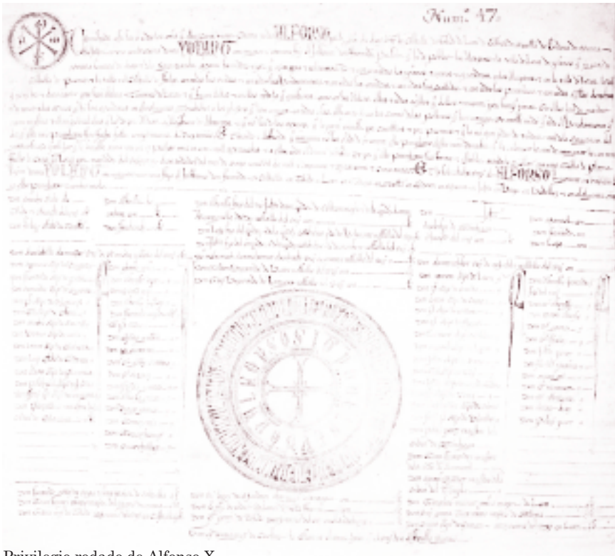
Privilegio rodado de Alfonso X

castellano. En 1257 el rey se encontraba en Lorca con el propósito de implantar el modelo cristiano de organización. En primer lugar concedió permiso para que los cristianos pudieran comprar terrenos y casas a los mudéjares de Lorca, lo que significa que a Lorca estaban llegando cristianos, lo que se conoce como primera repoblación.