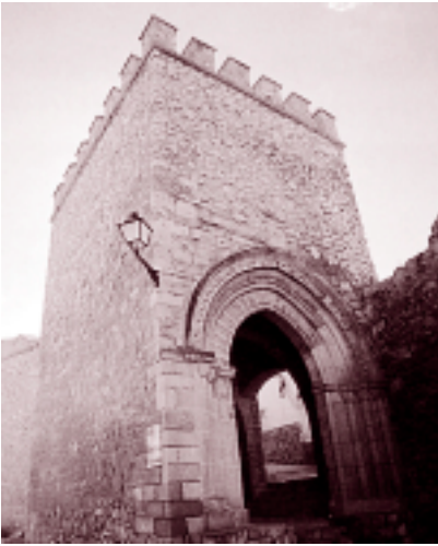
Porche de San Antonio