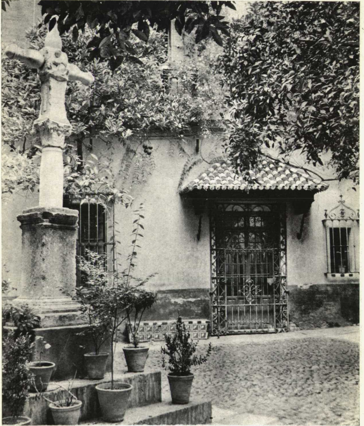
Un rincón del barrio sevillano de Santa Cruz.