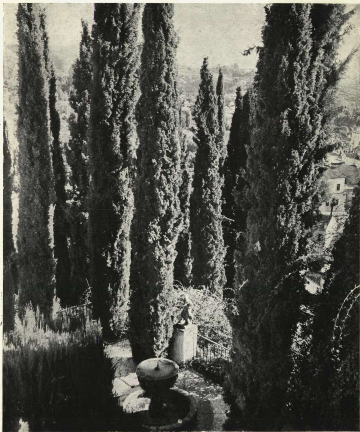
Los cipreses, adorno esencial de los jardines.