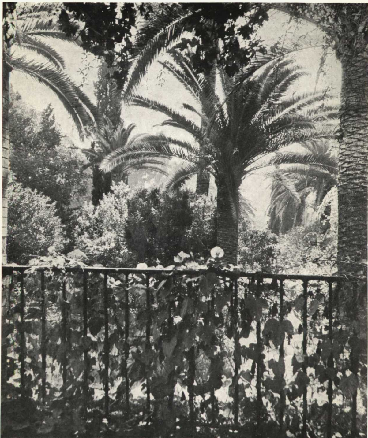
Un jardín andaluz, con palmeras como símbolo meridional y elemento decorativo.