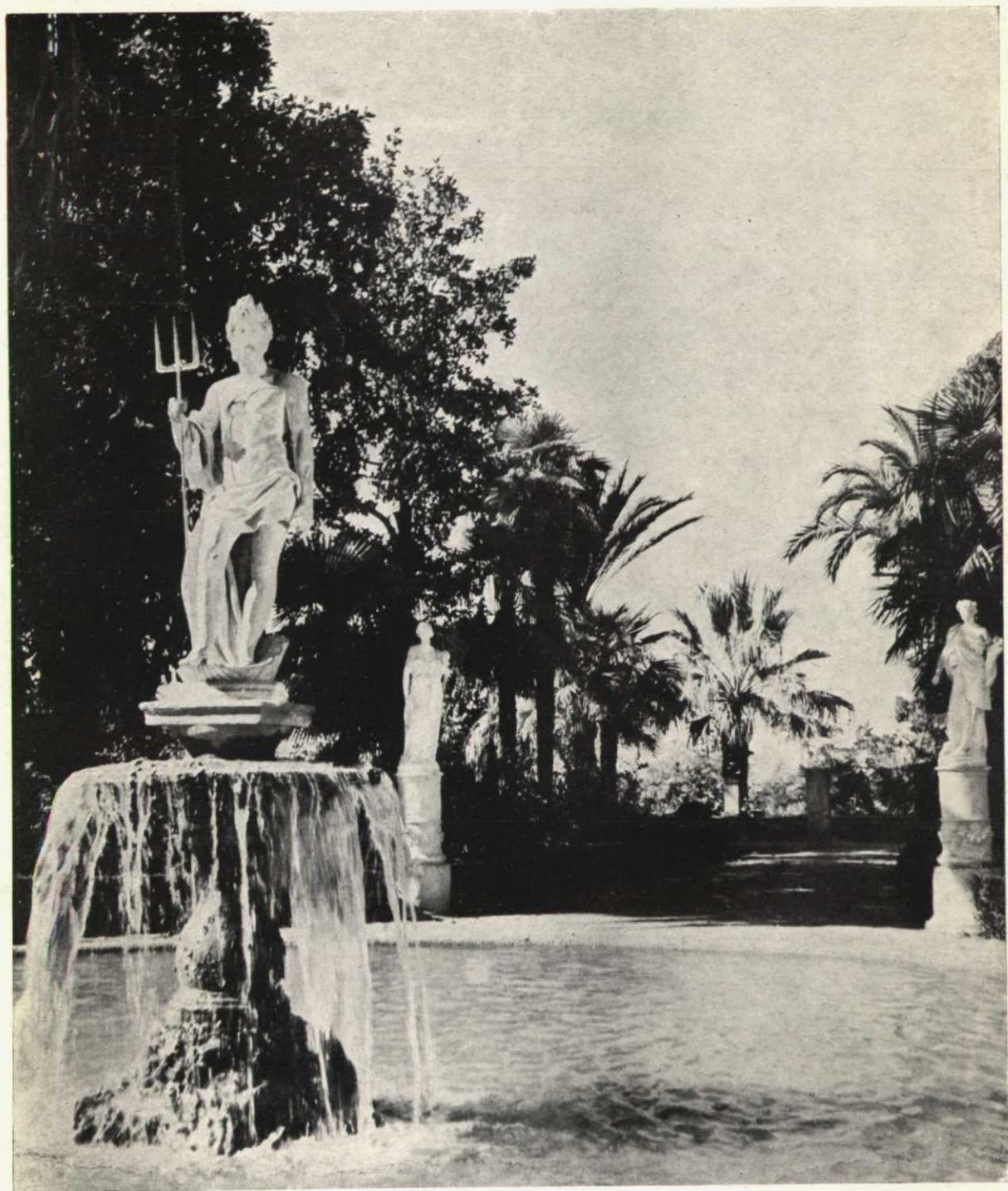
En muchos jardines españoles destaca, sobre el verde del paisaje, la blancura de unos mármoles antiguos.