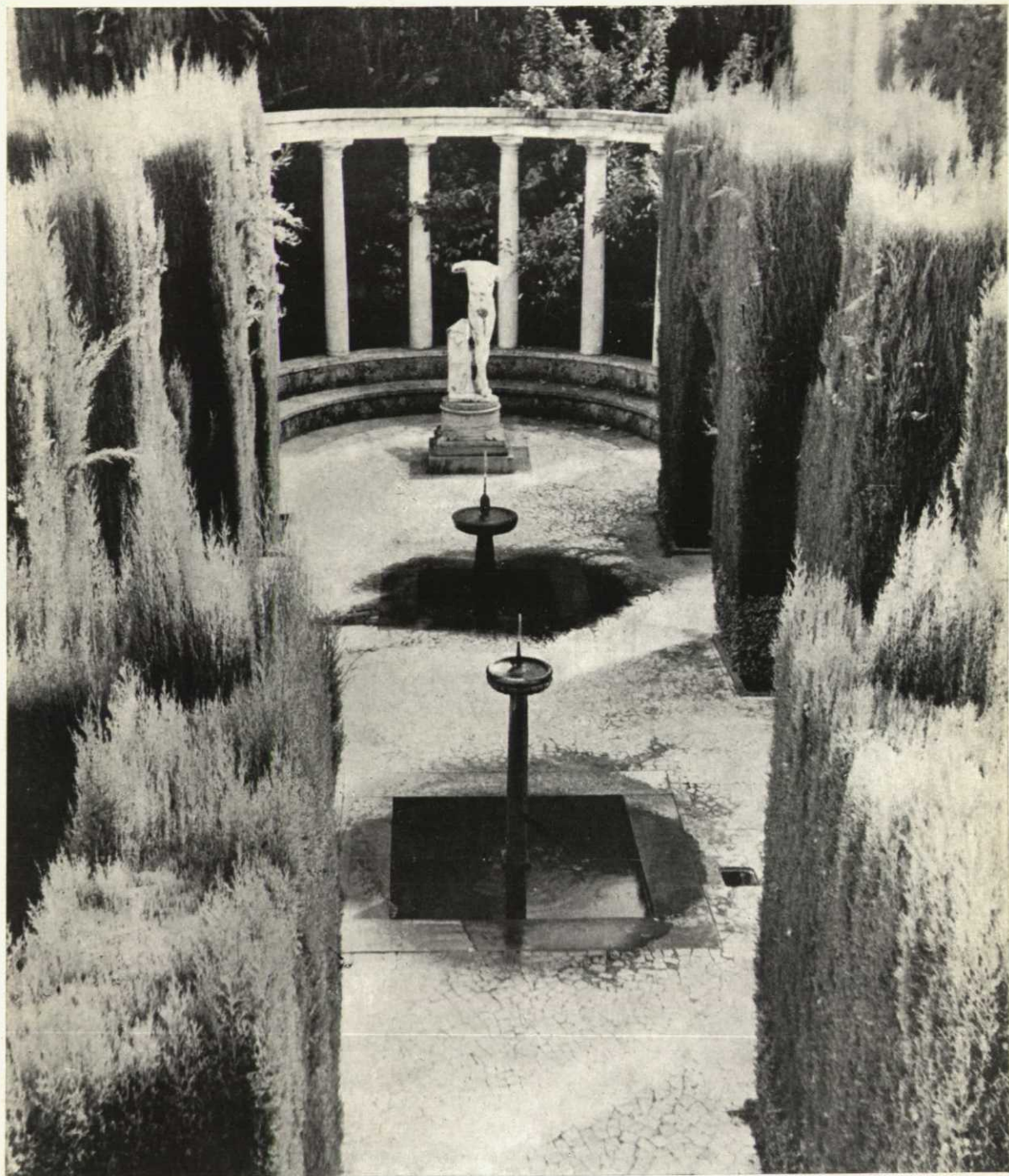
Otro ejemplo de la jardinería española, tan celosamente cuidada y atendida por el Estado.