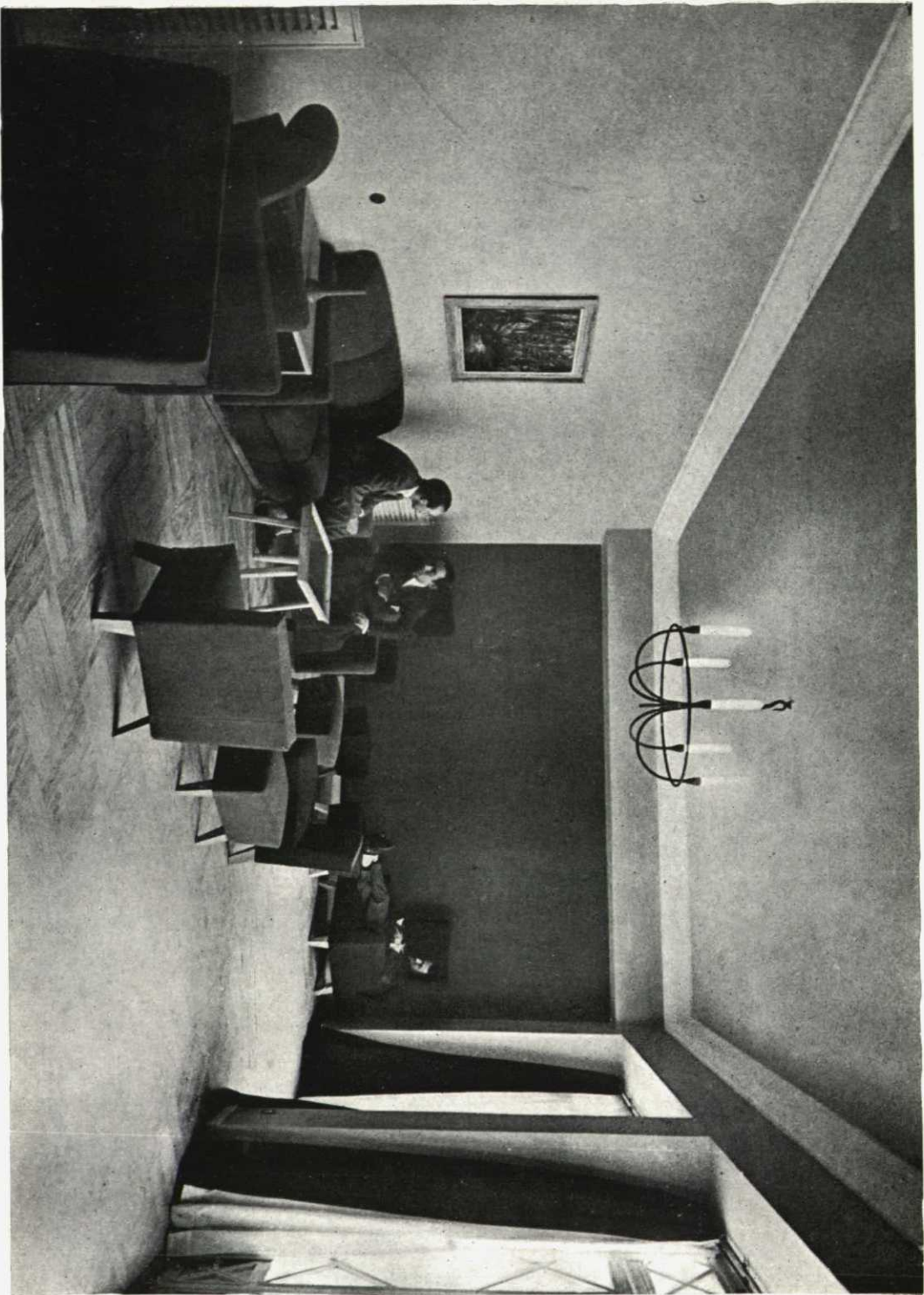
SALAMANCA.—Colegio Mayor Hispano Americano «Hernán Cortés». Sala de estar