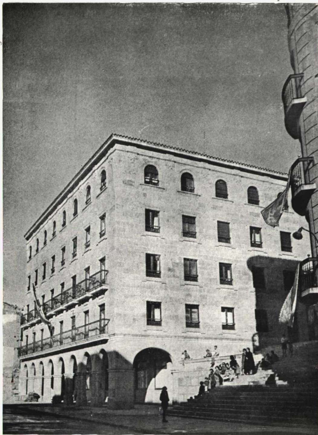
SALAMANCA.—Fachada del Colegio Mayor Hispano Americano «Hernán Cortés»