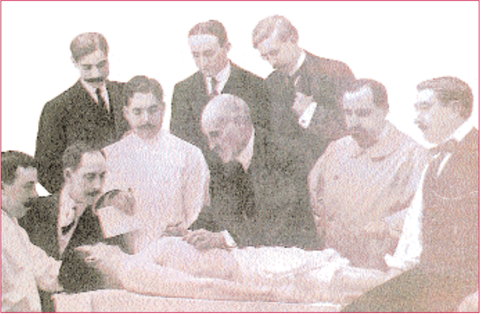
Clase de anatomía de Ramón y Cajal. Santiago Ramón y Cajal foi o milagre científico dos primeiros anos do século XX en España. No ano 1919 concedéuselle o premio Nobel de Medicina e Fisioloxía.

ciencia bioquímica española non aparecen científicos relevantes ata entrados os anos sesenta. O que se pode denominar núcleo orixinario, do que ían derivar as principais escolas de formación de bioquímicos, iníciase arredor do grupo de científicos que en 1963 fundan a Sociedade Española de Bioquímica, cun aglutinador clave que foi Severo Ochoa.