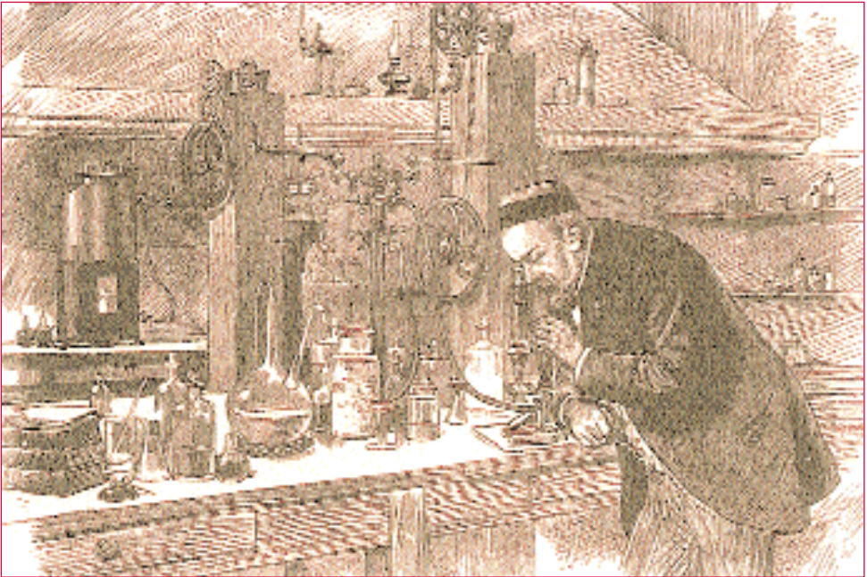
Pasteur no seu Laboratorio. Gravado de The Graphic, 1885.

de do século XIX—, de que a fermentación era un proceso químico, alentaba a rotura do vitalismo.