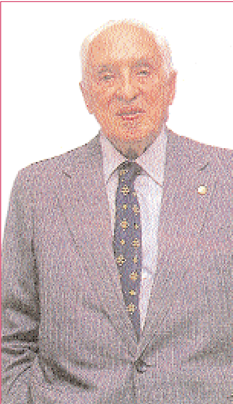
No ano 1959 o bioquímico Severo Ochoa obtivo o premio Nobel de Medicina e Fisioloxía polos seus traballos sobre o código xenético.