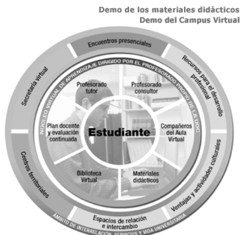
Figura 2. Modelo educativo de la UOC

El elemento que, a nuestro entender, expresa la centralidad organizativa y metodológica del modelo de la UOC es el plan docente o guía de aprendizaje . Se trata de un documento redactado por el profesorado de la universidad que expone al estudiante la organización del proceso de enseñanza y aprendizaje desde el primer día de clase . Es la guía base a partir de la cuál se accede a los objetivos de aprendizaje, a los contenidos, a los materiales de aprendizaje, a las actividades, al sistema evaluativo, bibliografía, planificación, etc. Es un documento de referencia para el estudiante que, en cierta forma, colabora en fomentar su proceso de autogestión del aprendizaje.