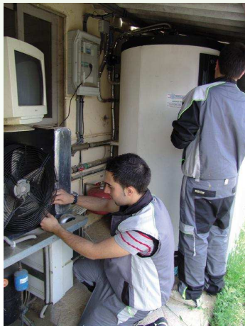
Alumnos do ciclo superior de Mantemento e montaxe de instalacións de edificio e proceso