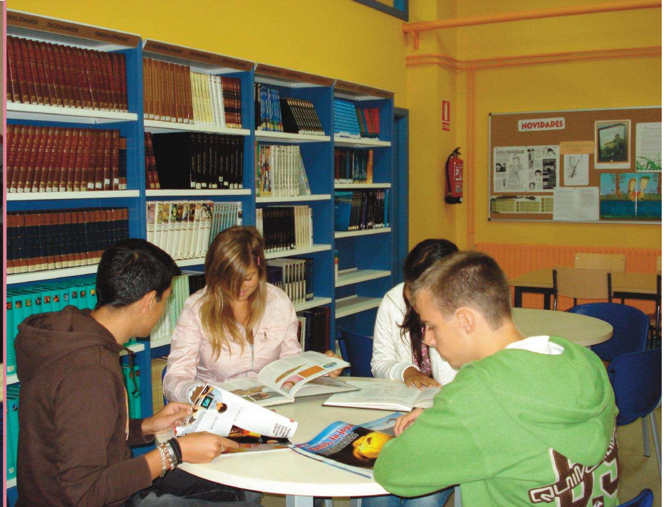
Os traballos compartidos resultan fundamentais para impulsar a participación

información se rexistra e se analiza co obxectivo de ter en todo momento un coñecemento preciso da problemática e poder transmitila á comunidade educativa para que tome as medidas que correspondan. Este observatorio elabora e analiza, como mínimo, un informe quincenal sobre os problemas de convivencia no centro.