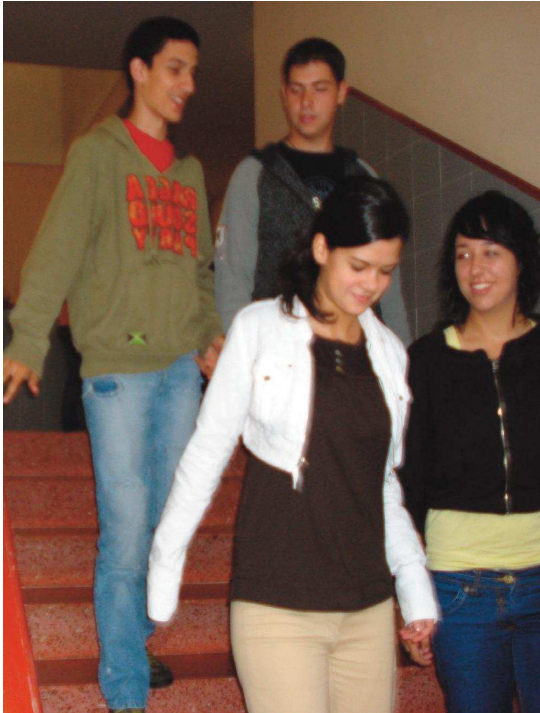
A consolidación dunha cultura de resolución pacífica de conflitos mellora as relacións entre os alumnos