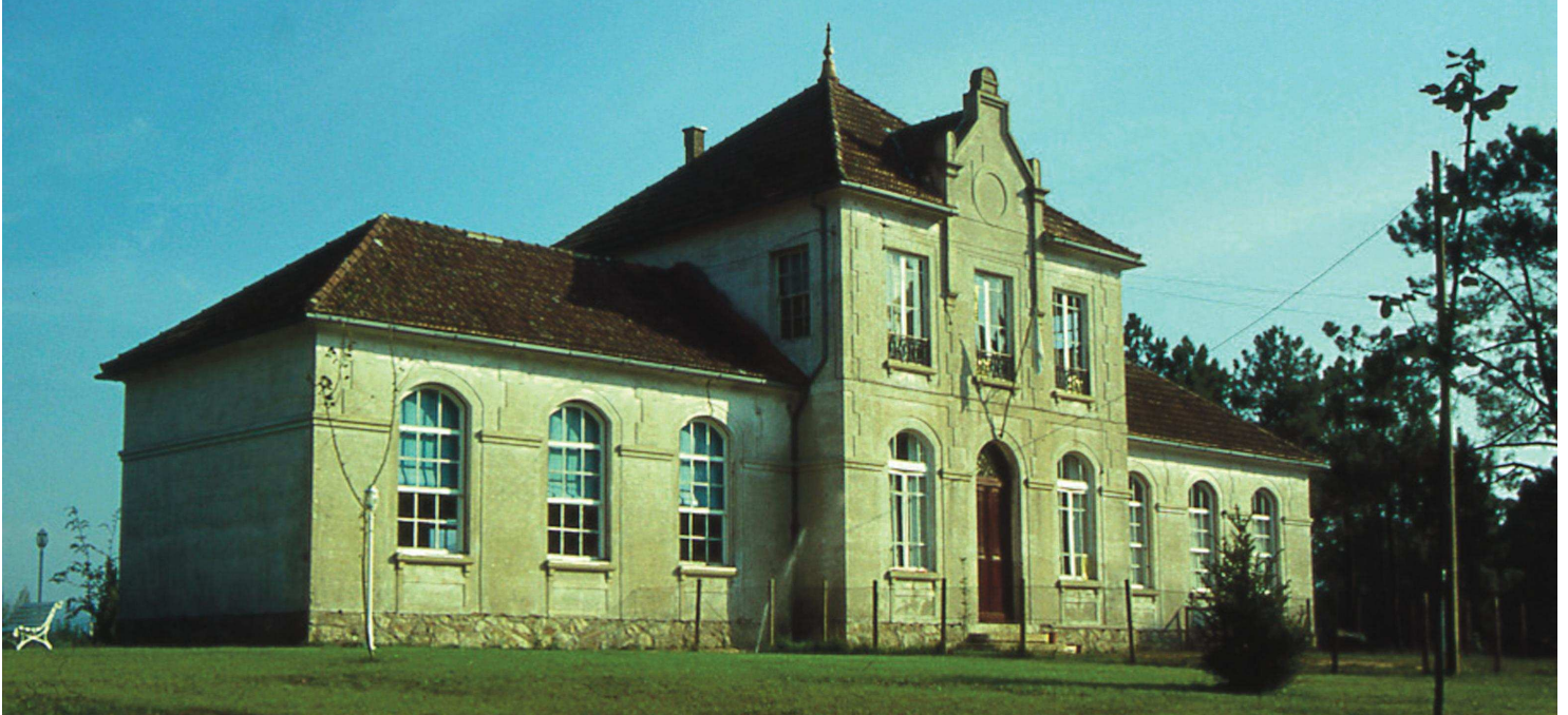
Tomiño, Pontevedra. Escolas Aurora del Porvenir, sostidas dende Brasil e Arxentina pola sociedade do mesmo nome

E isto ocorría a finais do século XIX no mundo rural e mariñeiro galego, onde se sufría un elevado índice de analfabetismo, unha economía agraria de subsistencia, ausencia de tecido industrial e escasas expectativas de futuro. En fin, ocorría baixo o férreo control dunha minoría privilexiada e excluín-te, que detía o poder dende o despacho municipal, o brasón palaciano ou o púlpito dominical, e que perpetuaba aquí o sistema do Antigo Réxime, cando en Europa maduraba a modernidade nacida da Ilustración.