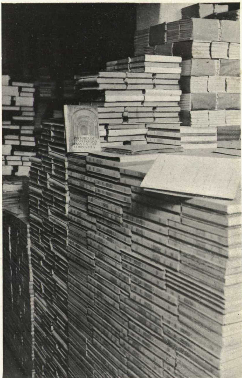
Un detalle del almacén de libros del Consejo Superior de Investigaciones Científicas,