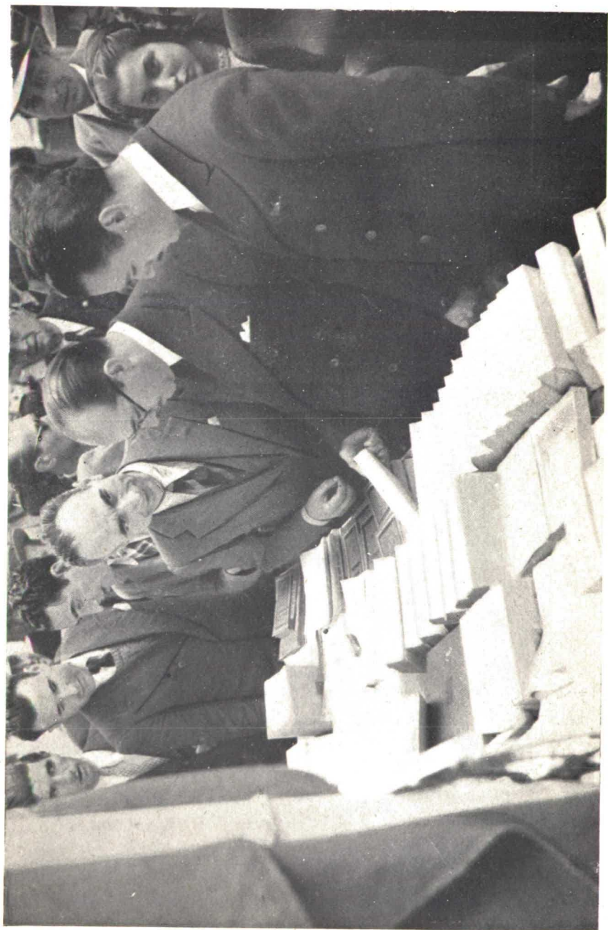
Sobre la mesa de uno de los puestos instalados, el día de la Fiesta del Libro, por el Consejo Superior de Investigaciones Científicas, se agrupan los ejemplares de la «Historia de las Ideas Estéticas», de Don Marcelino, que son examinados por el Ministro de Educación Nacional.