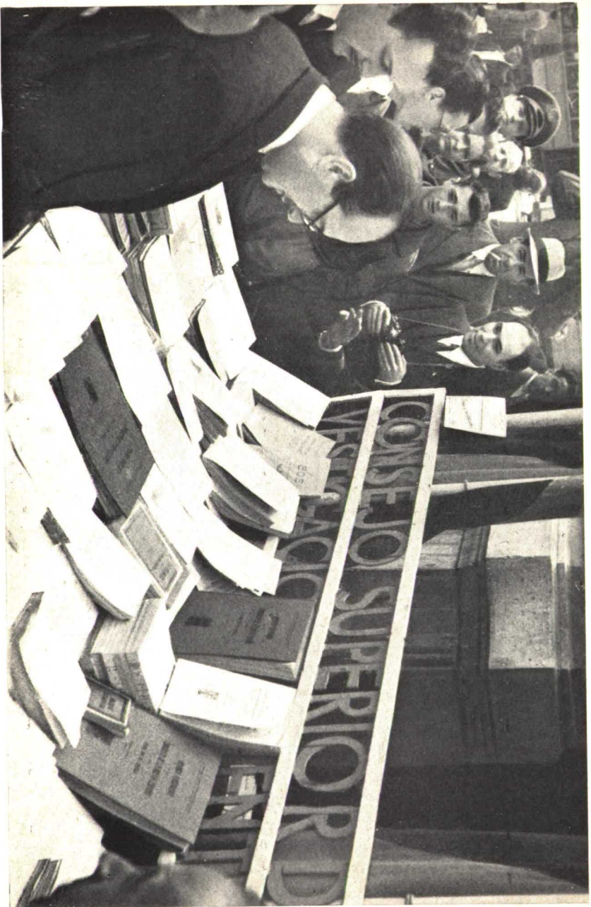
Uno de los puestos instalados en la vía pública, el día de la Fiesta del Libro, por el Consejo Superior de Investigaciones Científicas, que fue visitado por el Ministro de Educación.