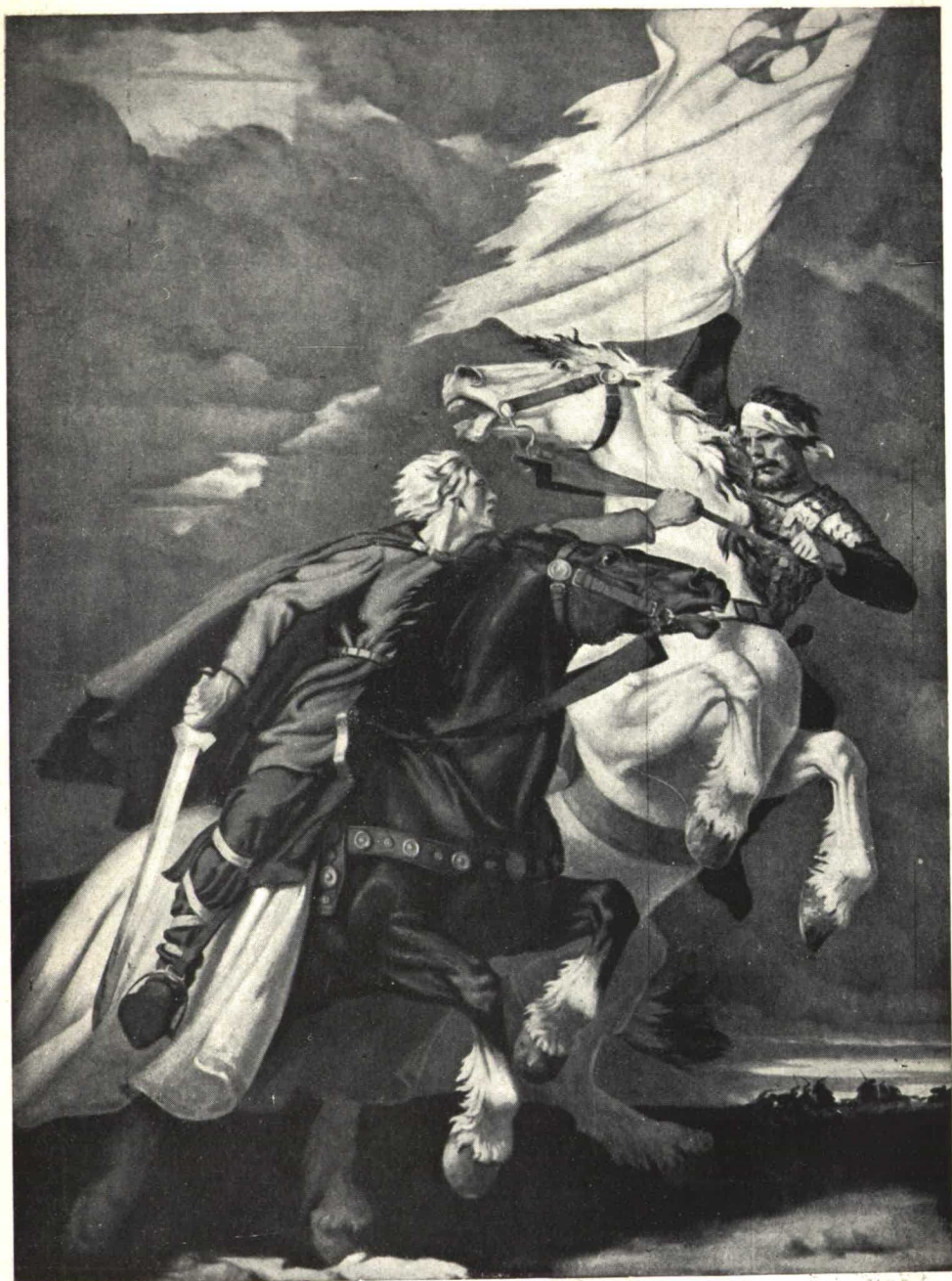
La Gran Exposición Alemana de Arte 1941, en Munich. POR LA BANDERA, por Herbert Kampf, Berlín.