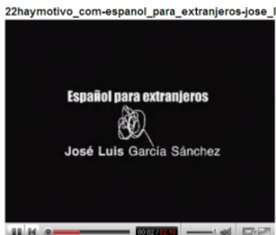
Figura 3: Video para la clase de español

5.- En otros blogs encontramos enlaces muy interesantes a videos adaptados que se pueden usar en la clase de español. En nuestra aula disponemos de un proyector conectado al ordenador portátil con lo que es muy fácil llevar a cabo esta actividad. Un video de ejemplo podría ser el siguiente 16