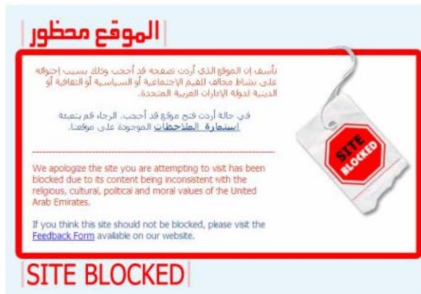
Figura 1: Página web bloqueada

El Ministerio de Educación y Ciencia español mantiene una página web bastante conocida por los profesores de ELE. Es redELE (red electrónica de didáctica del Español como Lengua Extranjera) 10 . A través de ella se puede acceder a recursos para docentes. Uno de los señalados era la dirección anterior. Sin embargo no podemos acceder a ella porque en el país en el que nos encontramos, Emiratos Árabes Unidos, se encuentra bloqueada.