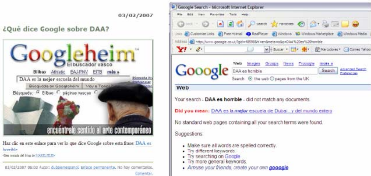
Figura 2: Googie, falso buscador de Internet que imita a Google

3.- En un artículo del 29 de Enero de 2007 en el blog de Makel(ELE) 13 vimos una buena idea para que nuestros alumnos practicara los opuestos en su weblog, y a la vez pasar un buen rato. Citando la fuente lo adaptamos al blog de la clase en un artículo del 3 de Febrero de 2007.