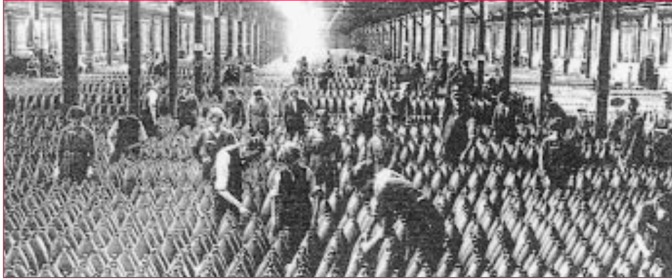
O prezo da guerra obrigou a transforma-las industrias civís en militares. Na imaxe, unha fábrica británica de munición en 1916.