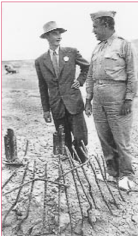
Robert Oppenheimer e o xeneral R. Groves no deserto de Novo México onde ensaiaron a bomba atómica.

te a bomba atómica, meta efectiva do programa. Organizouse un grupo con ese fin baixo a dirección de Robert Oppenheimer, físico teórico na Universidade de California, que elixiu Los Álamos, en Nuevo México, como lugar para fabrica-la bomba atómica. Oppenheimer foi o director do laboratorio, que se adxudicou á Universidade de California. En Los Álamos formou-