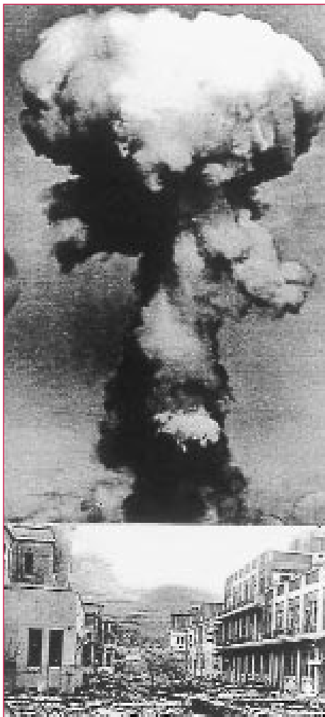
As dúas bombas atómicas botadas sobre Xapón quedaron como símbolo dos horrores da guerra na era da ciencia e da tecnoloxía.

Island (1979) —do que, por certo, nunca se deu información sobre o número de vítimas— e en Chernobyl (1986) non resulta raro o relativo pouco éxito da aplicación da física nuclear ó abastecemento de enerxía. Nin sequera coa crise de 1973 a enerxía nuclear chegou nunca a cumprir as expectativas creadas. Foi precisamente aquela crise, unida ás dificultades de evolución da enerxía nuclear, o que espertou a necesidade de buscar novas fontes de enerxía.