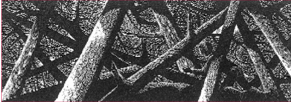
Gravado actual en madeira. A xustiza da restauración non é un camiño doado, sen embargo é máis satisfactorio e afirma o sentido da responsabilidade.

falan de “desorganización social” para se referiren a aqueles ambientes en que os rapaces medran sen dispoñer de pautas de comportamento normativas e sen oportunidades para progresar na sociedade.