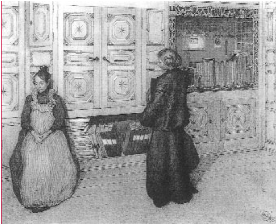
Nai e filla , de Carl Larsson, 1903. O entorno familiar é moi importante para establecer pautas de comportamento.

aquela situación na que un amigo do noso fillo lle pediu axuda para facer unhas tarefas escolares e este non o atendeu, preferindo ir xogar ¡unha vez máis! ó fútbol? Imaxinemos que o amigo do noso fillo suspende no exame, e por este motivo pasa uns días moi malos. Aquí hai unha oportunidade para a aprendizaxe desa “moralidade negativa”. Discuti-la situación co rapaz axúdalle a comprender por qué non debeu face-lo que fixo; é a reflexión sobre as consecuencias negativas do