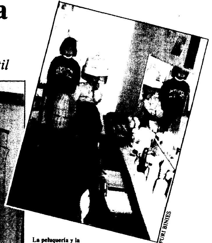
La peluquería y la clínica son algunas de las zonas preferidas por los niños para jugar y aprender.

ellos. A través del teléfono que comunica la casa con la oficina, en el teatro de títeres, en la peluquería o en el mercado arrancan del colegio tiempo y espacio para su expresión oral, concepto evaluable pero no siempre suficientemente practicado en unas aulas donde el niño debe guardar silencio para escuchar al profesor o para hacer bien la tarea. Y con esta potenciación autónoma de su expresión oral los niños se sumergen, sin darse cuenta, en la sociabilización, desde la decisión personal y en grupo de lo que cada uno «va a ser» respecto a los demás ese día o en ese momento.