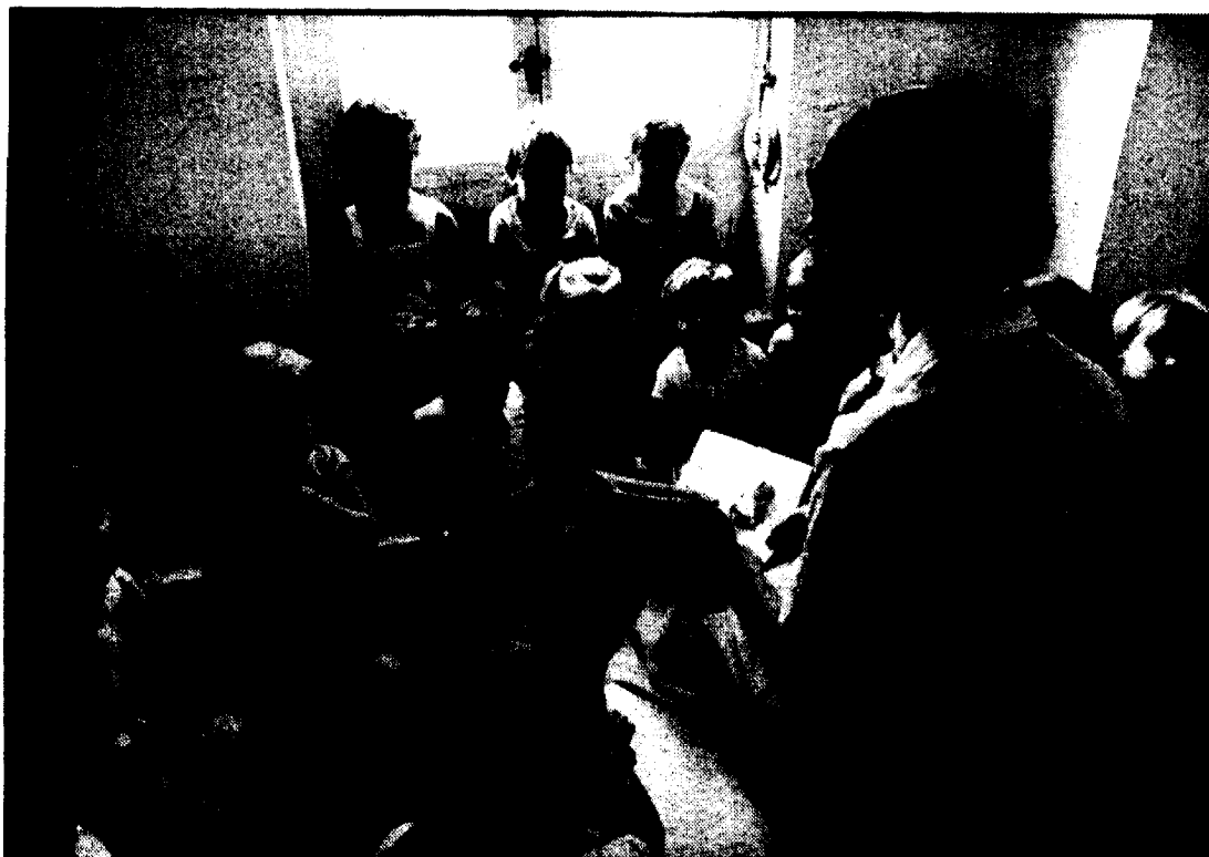
Se organizan actividades para ejercitar a los alumnos en métodos de investigación y análisis, que estimulen la desinhibición ante situaciones de injusticia, la toma de decisiones y el trabajo en equipo.

La dirección se ejerce de forma colegiada y el claustro trabaja en equipo. La participación de los