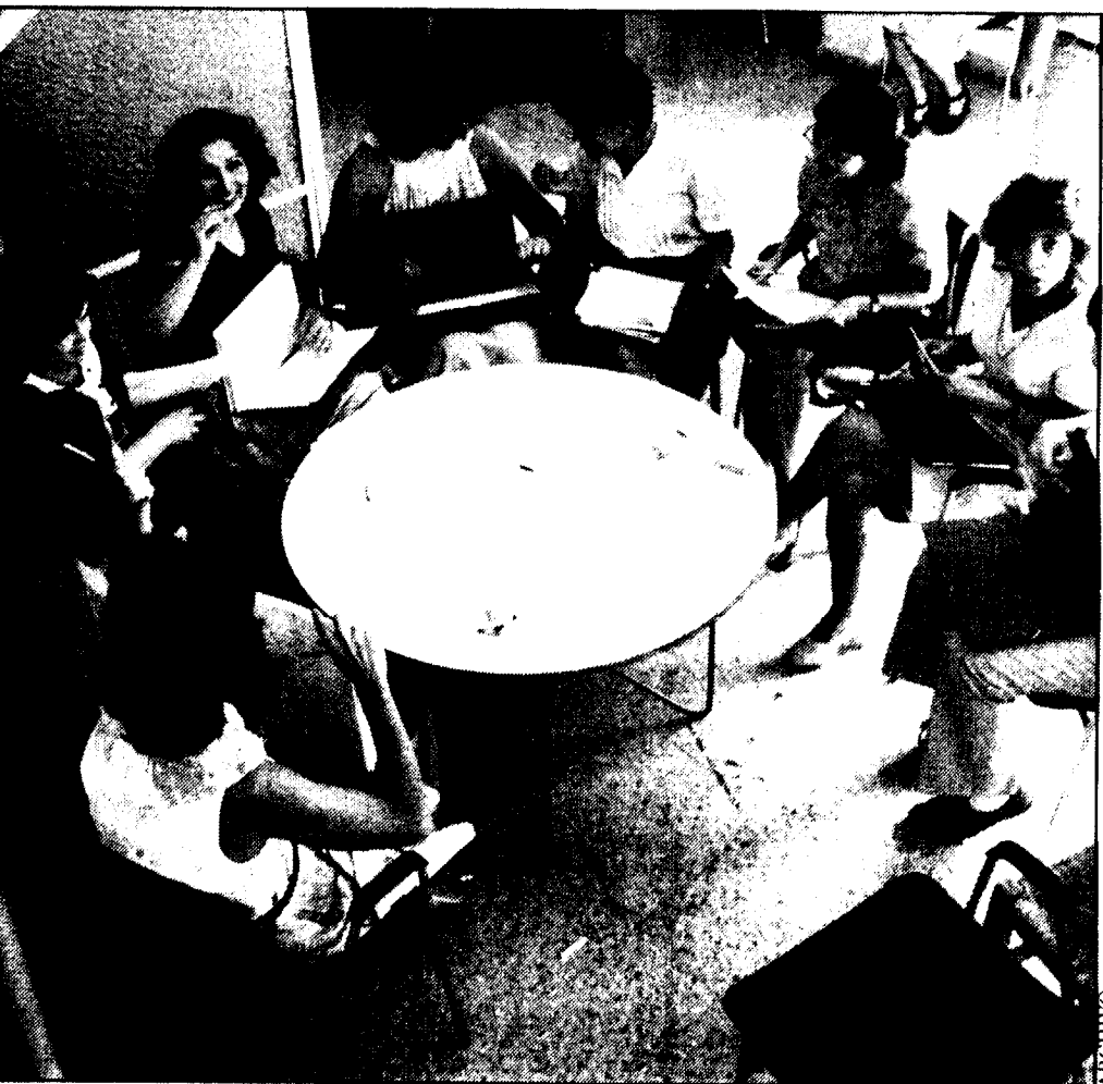
La oferta de propuestas para la formación del profesorado se ha incrementado considerablemente en los últimos años; de ahí la necesidad de mejorar la calidad de las Escuelas de verano y de adecuarlas a las actuales circunstancias.

Como ejemplo, voy a explicar la programación de este curso.