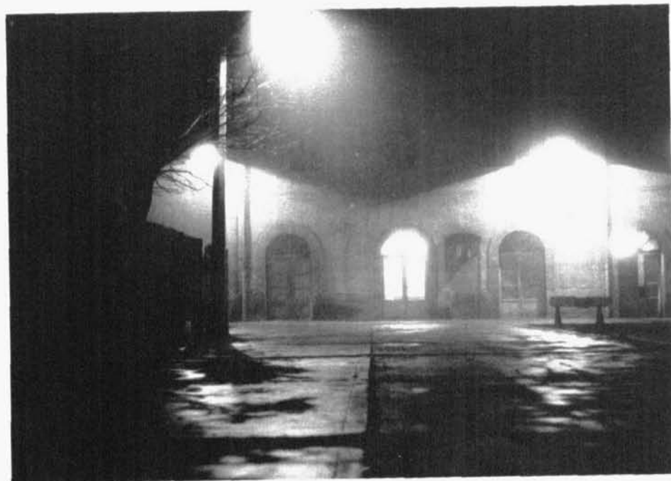
«La vieja estación» de Ángel Alonso Gundin. 2.º premio blanco y negro.