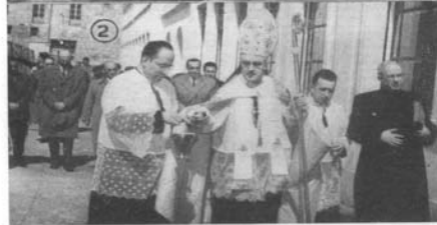
INSTITUTO «CARDENAL LÓPEZ DE MENDOZA» DE BURGOS.—1. Vista general del nuevo edificio.—2. Bendición del edificio por el Obispo Auxiliar de la Archidiócesis.