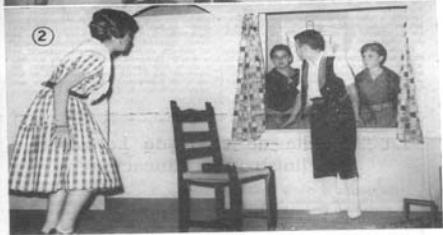
INSTITUTO «SANTA IRENE», DE VIGO: 1 y 2. Dos escenas de la representación teatral, en las fiestas del Patrono de los estudiantes.