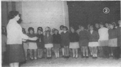
INSTITUTO «SANTA IRENES, DE VIGO»: 1. Los Coros del Centro, en el festival artístico del día de Santa Tomás.—2. Actuación del Coro femenino.