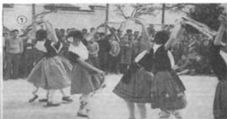
1. Un grupo de alumnas, ataviadas con trajes típicos, interpreta bailes regionales en las fiestas de Santo Tomás.