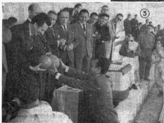
3. El Director del Instituto en- trega un premio a la Escuela del Magisterio.