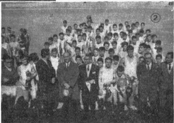
2. Alumnos del Instituto con las autoridades locales, al terminar las competiciones deportivas.