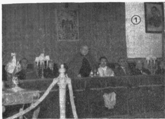
INSTITUTO NACIONAL DE CUENCA: 1. El Prelado de la diócesis, en el acto académico de: Santo Tomás.