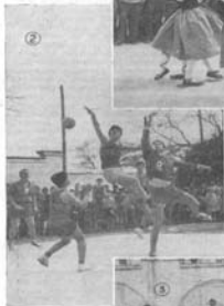
2. Exhibición deportiva a cargo de las alumnas.