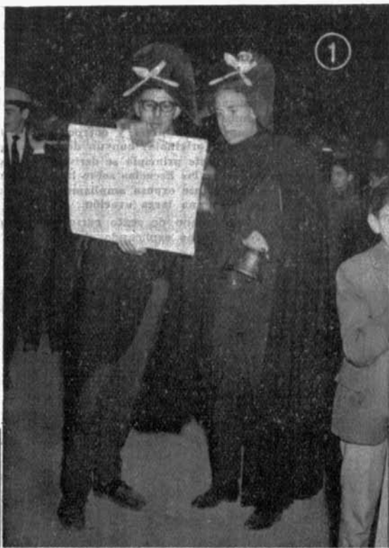
INSTITUTO DE SEO DE URGEL: 1. Un miembro de la Tuna lee el pregón de las fiestas tomasinas