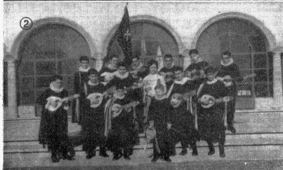
INSTITUTO DE JEREZ DE LA FRONTERA: Las Tunas masculina (1) y femenina (2) que intervinieron en las fiestas del Patrono de los estudiantes.