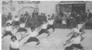
3. Una tabla de gimnasia rítmica.