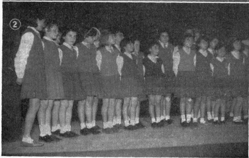
INSTITUTO DE CEUTA: 1. Modalidad de baile andaluz interpretado por las alumnas.— 2. Coros femeninos en un momento de su actuación en la fiesta de Santo Tomás.