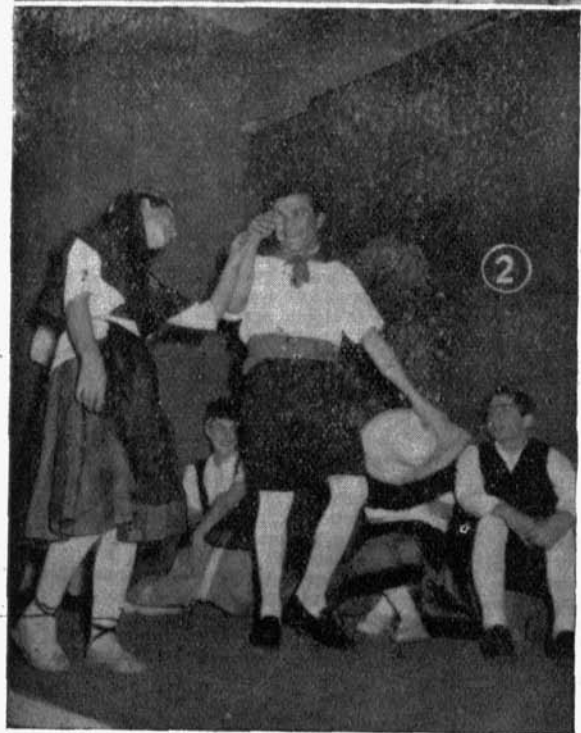
INSTITUTO MASCULINO «PA- DRE ISLA», DE LEON

1 y 2. Dos escenas de «El villano en su rincón», representada en la Fiesta de Santo Tomás.