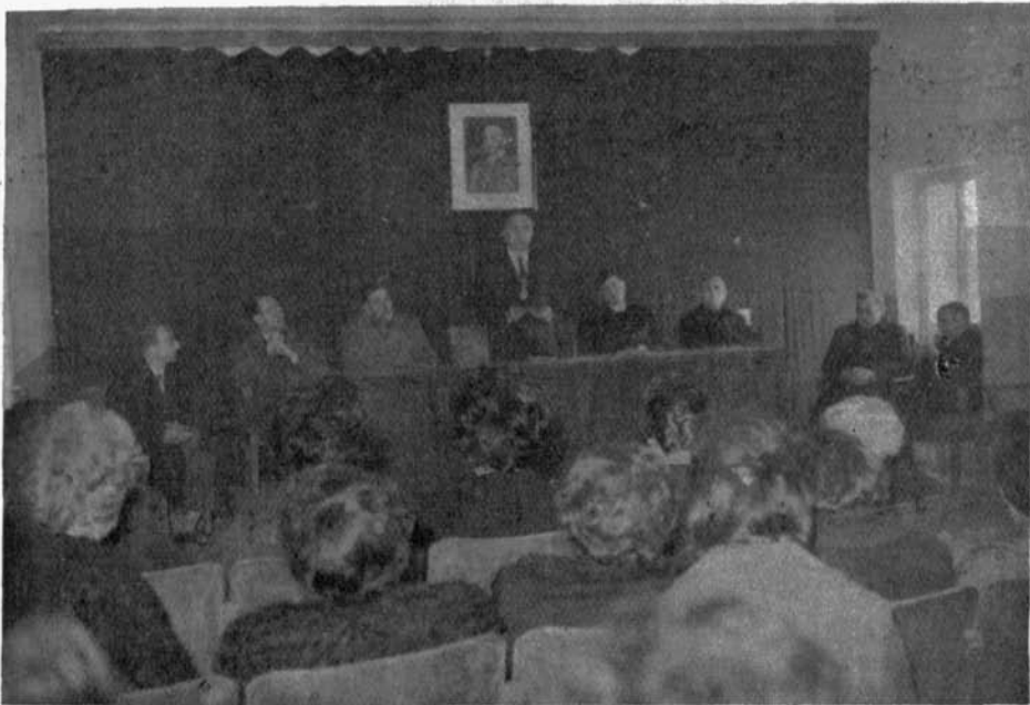
INSTITUTO DE PUERTOLLANO: Acto académico en el día de Santo Tomás.

Un alumno de sexto curso pronunció breves palabras explicando el significado de la fiesta.