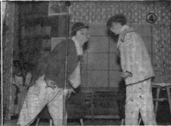
COLEGIO «MELCHOR CANO», DE TARANCON: 1, 2, 3 y 4. Aspectos de la velada artístico-cultural celebrada en el teatro-Alcázar, con motivo de las fiestas del Doctor Angélico.