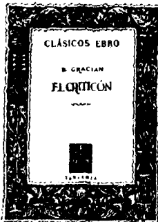
Facsimil de una de las cubiertas

LOS LIBROS QUE NUNCA ENVEJECEN PORQUE SUS AUTORES LEGARON CON ELLOS A LA POSTERIDAD UN TESORO DE CULTURA Y UNA SÍNTESIS PERDURABLE DEL GENIO ESPAÑOL