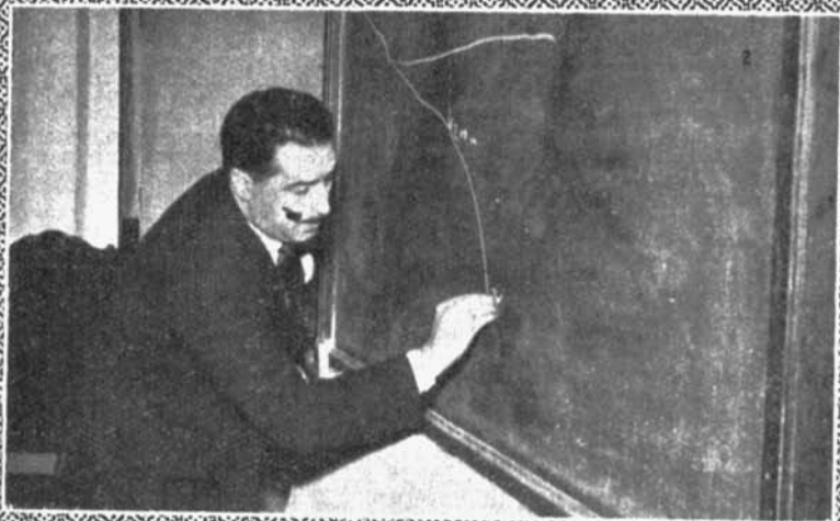
INSTITUTO «EL BROICENSE»: 1 y 2. Dos momentos de la conferencia del Excmo. señor don José Luis de Azcárraga y Bustamante sobre «El régimen jurídico de las aguas».