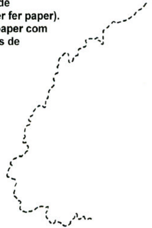
Paper convencional (NO reciclat)

D'un arbre de més de vint anys només se'n treu una tona de cel·lulosa (pasta per fer paper). Per cada quilo de paper com aquest en calen dos de fusta... 400 litres d'aigua i molta energia. I això pot evitar-se.