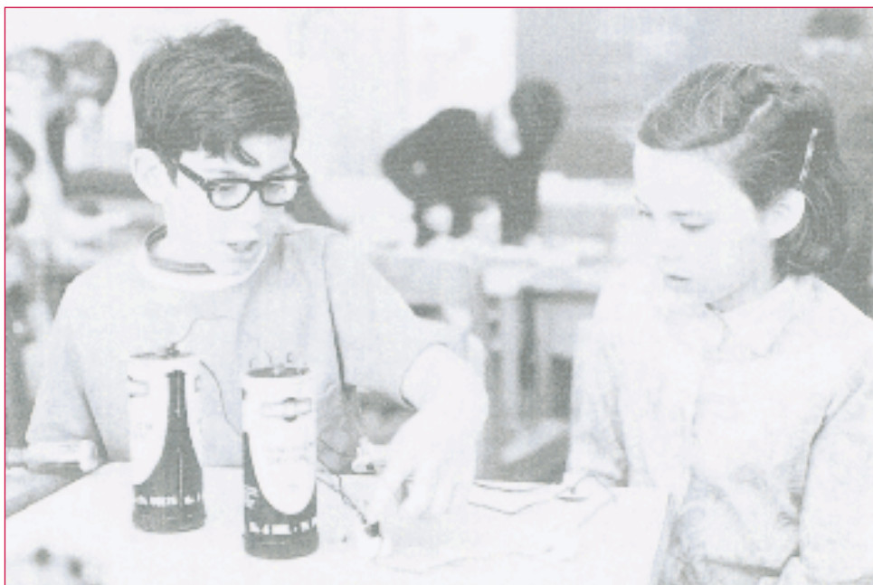
"A colaboración entre iguais pode favorecer-la aprendizaxe por descubrimento".

— Mediante o debate e o feedback mutuos, os compañeiros rexeitan erros máis doadamente e afánanse en mellores solucións.