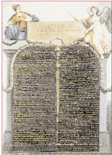
Déclaration des droits de l'homme et du citoyen. Neste texto da Revolución Francesa basearase máis adiante a Declaración dos Dereitos Humanos das Nacións Unidas.