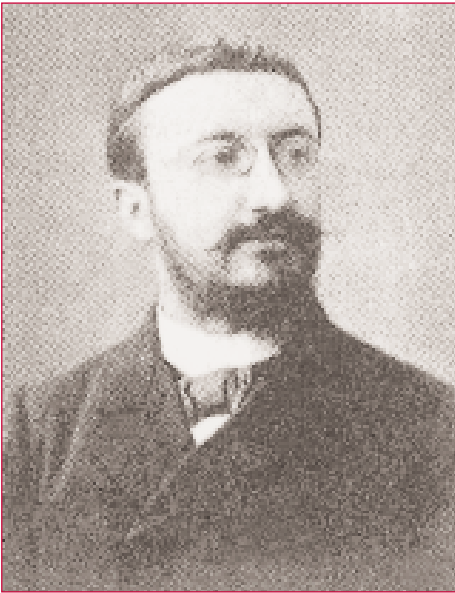
Alfred Binet é o pai dun dos tests de intelixencia máis coñecidos.

Nova York eran débiles mentais, polo que moitos deles foron devolvidos ós seus países. É unha mágoa que non se decatara de que o deseño do test non respondía a este tipo de suxeitos, ós que se lles formulaban cuestións das que nunca escoitaran falar. Outro grande adaptador americano deste test foi Terman (1877-1956), que sostíña posicións racistas e fomentou a esterilización dos débiles mentais.