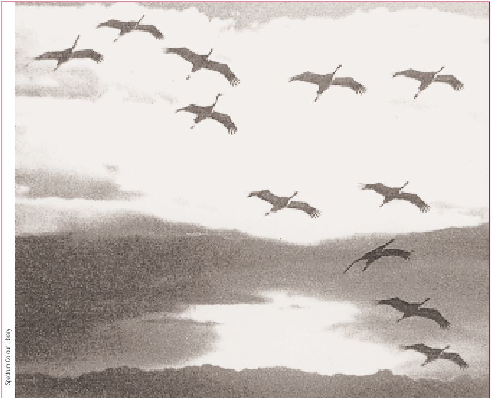
Migración de grou. Os costumes ou reaccións sociais dun grupo de individuos no seu ciclo de desenvolvemento é sinal de vida.

viduo, ó ecosistema ou mesmo á sociedade, no caso do home e de animais con estruturas semellantes (formigas, abellas, aves migratorias). Sempre ocorre que nas estruturas xeradas como consecuencia de agregacións doutras de menor nivel, aparecen características que non son a suma das que tiñan os compoñentes por separado. O funcionamento do cerebelo vai moito máis aló da suma das funcións das diferentes células que o compoñen, o mesmo