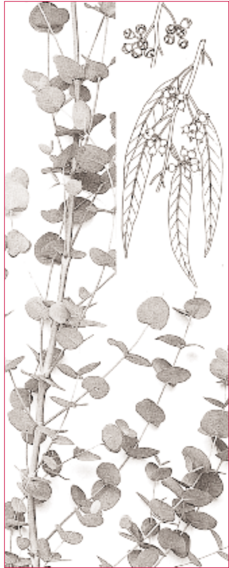
A metamorfose é un sinal da vida que se pode observar nalgúns vexetais como no eucalipto. Foto dunha árbore nova, e no recadro debuxo de follas adultas.

De xeito xeral, as características que presento e comento aparecen xuntas en tódolos seres vivos. Quero insistir de novo en que non teño en conta