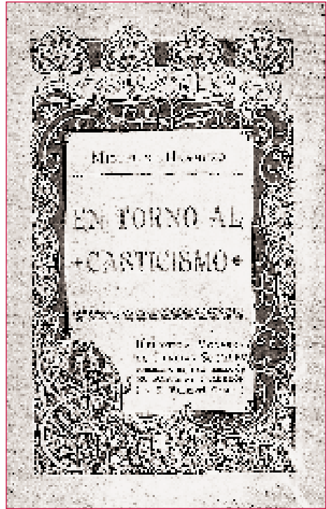
Cuberta da primeira edición de En torno al casticismo .

Unamuno coincide con Nietzsche nesta actitude condenatoria do quefacer dos historiadores 9 . Ó examinalos conceptos de 'casticismo' e 'tradición' nos ensaios incluídos en En torno al casticismo (1902) 10 , o autor destaca un grupo de defensores da tradición, "los dedicados a ciertos estudios llamados históricos", que dalgún xeito semellan se-los maiores responsables da propagación de falsos casticismos. Segundo Unamuno, estes profesionais da historia pasan a vida "recolectando papeles, resucitando cosas muertas..., haciendo bibliografías y catálogos, y hasta catálogos de catálogos". Por iso os compara con desenterradores de cadáveres e con entomólogos que se dedican a