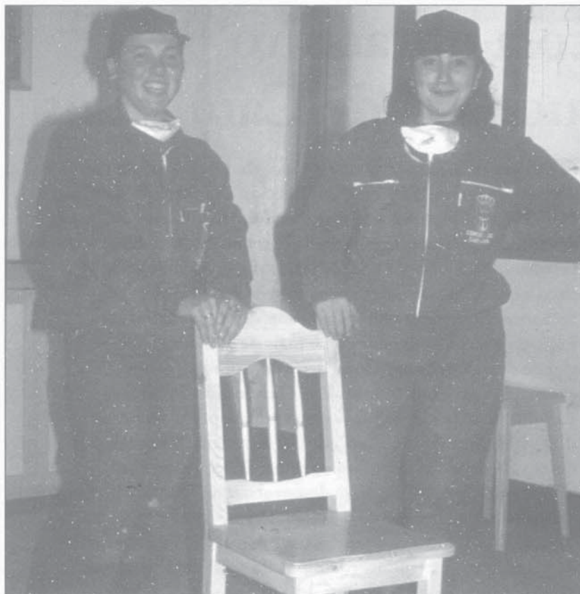
1.- Elaboración dun proxecto persoal.

a realización dunha experiencia novedosa, tanto no que se refire ó seu planteamento dentro da Formación Ocupacional, como a súa aplicación práctica e conseguinte repercusión social: o Servicio de Axuda a Domicilio.