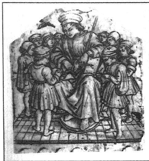
O Mestre de escola. Gravado de Maso Finiguerra, arredor de 1457. As actitudes que se mostran non semellan risco de accidente.

A Lei 4/1999, do 13 de xaneiro, de modificación da LRXAP-PAC, suprime a referencia á responsabilidade civil dos